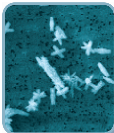
Kalkkrystaller behandlet med AMTech 100 ®