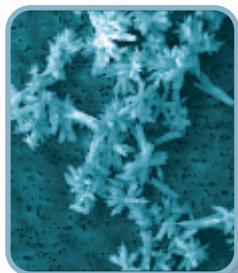
Kalkkrystaller sammenklynget i ubehandlet vand

Den energi, som AMTech 100 ® tilfører vandet, gør at vandet får karakter af blødt vand (indeholder dog samme mængde kalk som tidligere). Det behandlede vand vil på sin vej gennem rør o.lign. tiltrække ekstra kalkkrystaller, og det er derfor, at rør og sanitet efterhånden kommer til at indeholde mindre og mindre kalk.